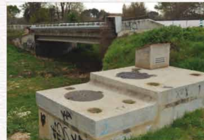
3 - Punt del transvasament de l'Ebre. A l'alçada del pont podem veure com el colze de la canonada passa pel pont (canonada negra) junt amb d'altres que porten aigua a les cases de l'eixample.