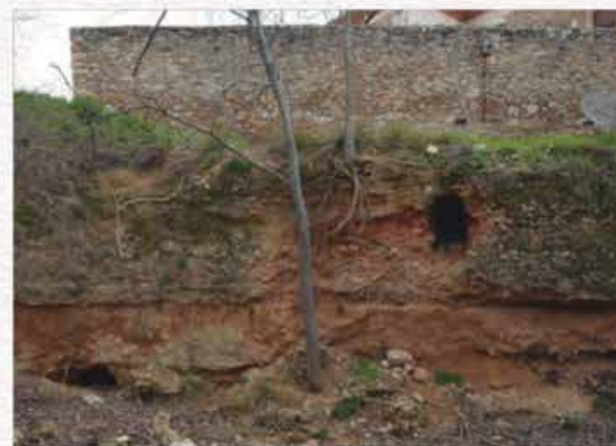
2 - Coves d'accés a la mina. Aquestes coves comuniquen amb la mina; es pot entrar per una i sortir per l'altra. Segurament servien per tasques de neteja. Són molt profundes.