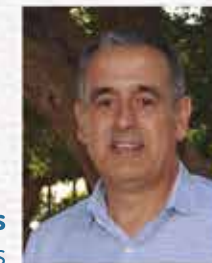
Jordi Marlès Ribas Alcalde de Llorenç del Penedès