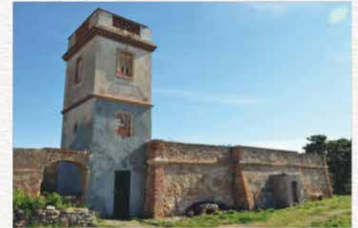
Torre i bassa.