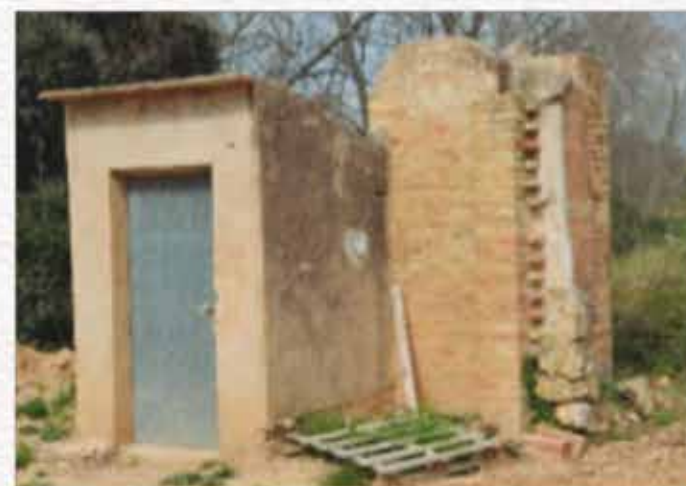
1 - Pou. Comunica amb la mina.

En aquesta zona plena de plataners també hi podem veure tres coses: