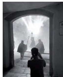
2on premi concurs Instagram