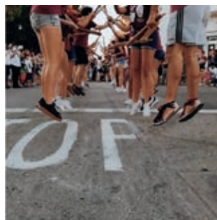
1er premi concurs Instagram

Des del consistori es vol agrair la feina i l'esforç de les entitats i especialment de la comissió organitzadora del sopar popular per la seva gran implicació en la Festa Major.