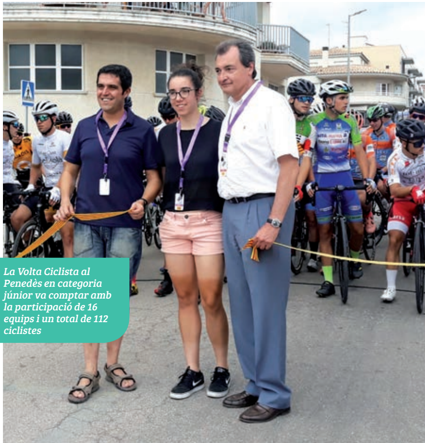
La Volta Ciclista al Penedès en categoria júnior va comptar amb la participació de 16 equips i un total de 112 ciclistes

El dia 8 de setembre es va donar per finalitzada la temporada d'estiu de la piscina municipal. L'equipament va obrir el 22 de juny amb la voluntat d'oferir a la ciutadania una alternativa per a gaudir del bany i fer front als episodis de calor. Enguany el nombre de persones usuàries s'ha mantingut similar al de l'any 2018. Així mateix, han estat molts els veïns i les veïnes que han optat per adquirir els abonaments que s'han posat al seu abast a preus econòmics.