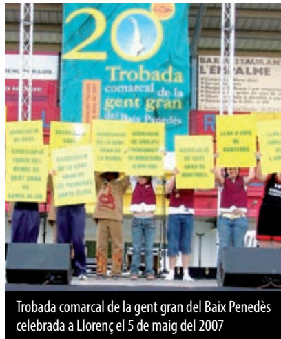
Trobada comarcal de la gent gran del Baix Penedès celebrada a Llorenç el 5 de maig del 2007

La iniciativa se celebra al juny i s'organitza de forma conjunta amb Bellvei i Llorenç