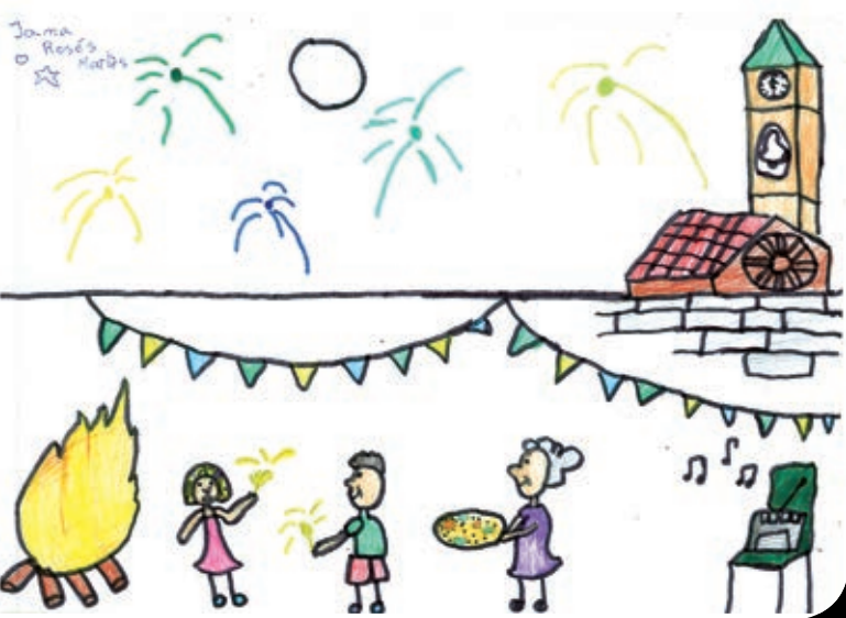
Dibuix fet per: Jana Rosés Mariés