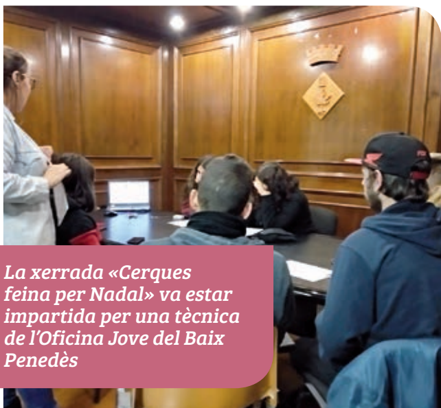
La xerrada «Cerques feina per Nadal» va estar impartida per una tècnica de l'Oficina Jove del Baix Penedès