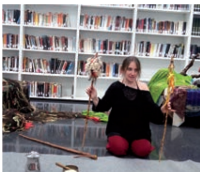
● Activitats per a commemorar la Diada de Sant Jordi