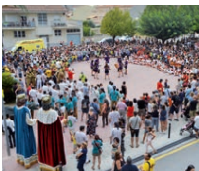
● La Festa Major d'Estiu, molt participativa