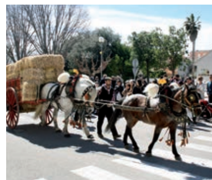
● Gaudint de la tradició dels Tres Tombs