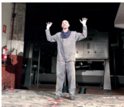
● Llorenç, primer municipi del Baix Penedès a adherir-se al festival EVA