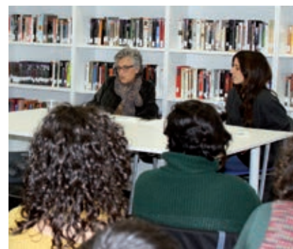
● Oferint suport als escriptors locals