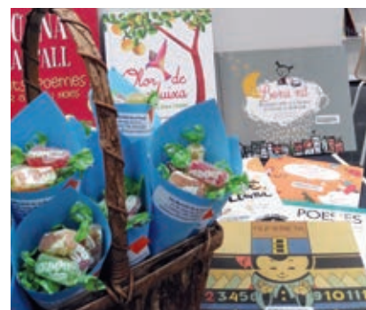
● Celebració del Dia de la Poesia