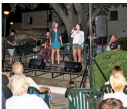
● Concerts a la fresca en diversos racons del municipi