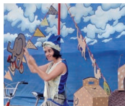
● Per Sant Joan, la Festa Major Petita